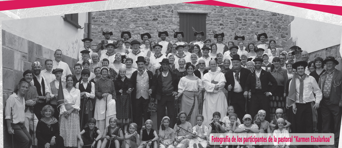
Fotografía de los participantes de la pastoral "Karmen Etxalarkoa"

A través de la ruta "Karmen de Etxalar", realizada con ilusión y trabajo comunitario, pretendemos mostraros el pueblo de Etxalar de la época de esta mujer valiente y libre.