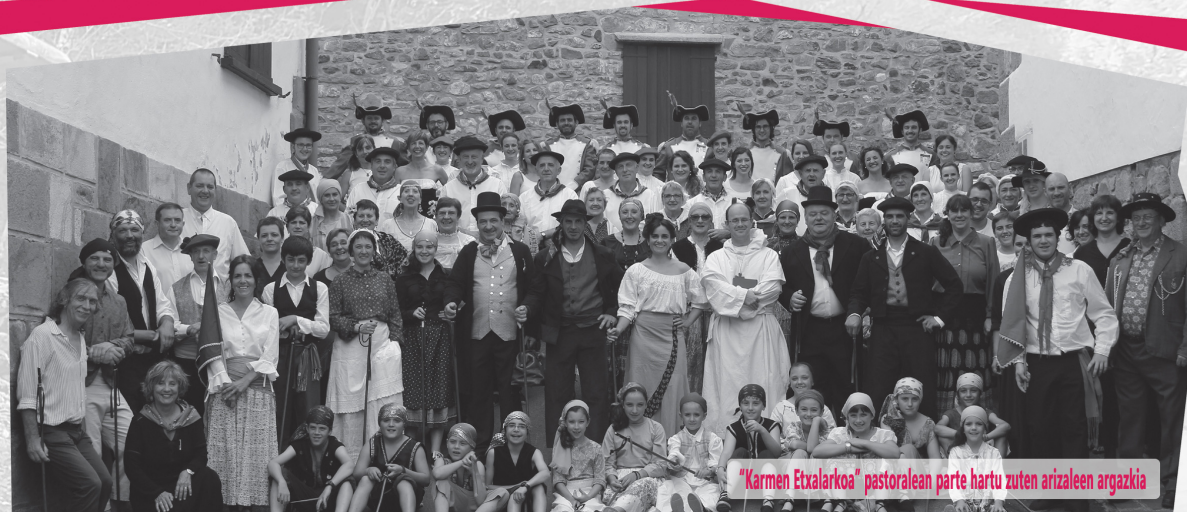
"Karmen Etxalarkoa" pastoralean parte hartu zuten arizaleen argazkia

XIX. mende hasieran, Karmen izeneko neskatila bat bizitu omen zen Etxalarren, Prosper Meriméeren nobelagatik ezaguna egin zena eta famatu bihurtu zena Bizeten operaren ondorioz. Karmen, Errotxen bordan jaio omen zen, Larrapil Sarrikuko auzoan eta gaztetxo bat zelarik, uholdeak egon ziren gau batean, ijitoek bahitu omen zuten eta Sevillarat eraman. Bere omenez eta haren pertsonaia euskalduntze arren, 2017ko irailaren 17an, Karmen Etxalarkoa Pastoralaren aitzinera atera zuen Etxalarko herriak. Emakume ausart eta aske honen garaiko Etxalar aurkeztu nahi dizuegu Karmen Etxalarkoa ibilbidearen bidez, ilusioz, auzolanean eginikoa.